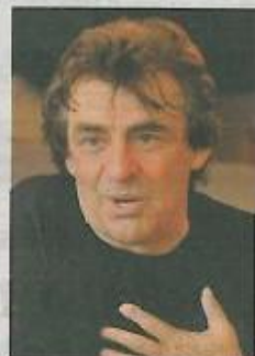
Claude Barzotti.

C'est tout aussi faux. Plus jamais nous ne travaillerons avec ce monsieur. Il a fixé une date en novembre sans m'en parler et a présenté ça comme si tout était arrangé, mais nous n'avons plus eu le moindre contact avec lui. Tout ce que dit ce type est complètement bidon!