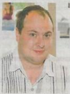
Capelleman: pas ma faute. ■ LEF

Y'a-t-il encore des contacts avec l'équipe du chanteur? "Oui, j'attends une nouvelle date, fin de l'année ou début de l'année prochaine pour le concert", confirme l'organisateur. "Non, on ne veut plus entendre parler de ce