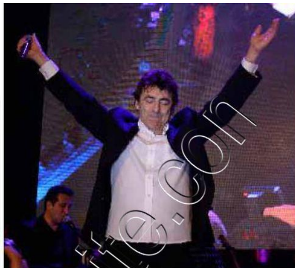
Son nouvel album sort début juin 2015.